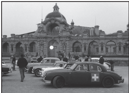
Mk I „Battleship“

Wieder kann unsere Firma auf ein aufregendes Jahr zurückschauen. Für mich begann das Jahr fast wie immer, mit dem Monte Carlo Rally der Engländer. Dieses Mal in einem MkI. Unerwarteterweise errangen wir sogar den dritten Rang in unserer Klasse.